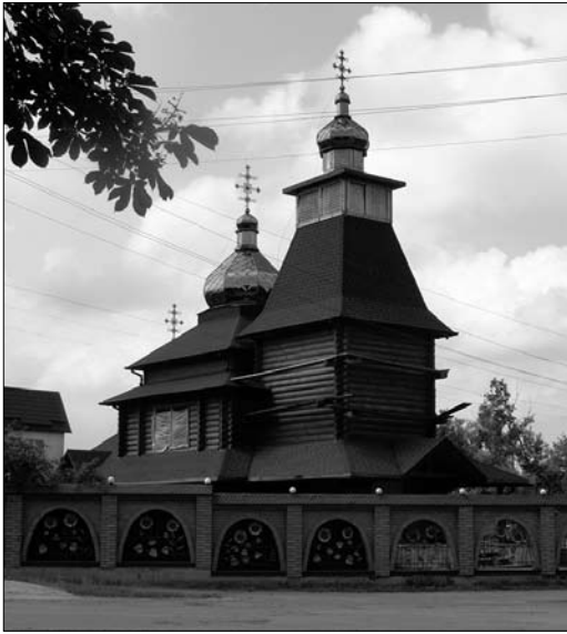
Іл. 27. Лемківська дерев'яна церква Святих Петра і Анни в м. Красне Бузького району, збудована за проектом Я. Тараса у 2018 р.

ученим, скільки часу організаційно-наукової праці покладено для повновартісного функціонування фольклористично-етнографічної комісії Наукового товариства ім. Шевченка у Львові. Погодьтеся, що занадто велика і відповідальна наукова-дослідницька ноша випала на плечі вченого Ярослава Тараса, і він її впевнено несе власною персоною, не перекладаючи, як це часто роблять інші, — на своїх колег.