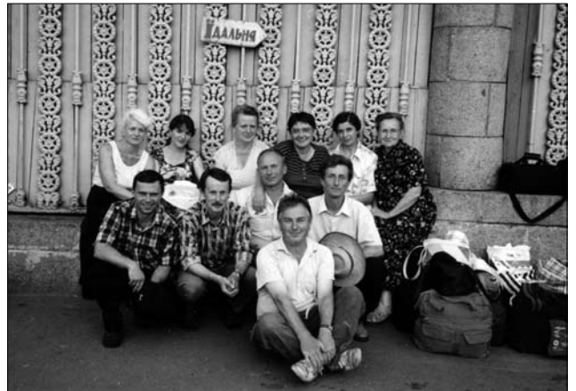
Іл. 3. Члени Чорнобильської експедиції на залізничному вокзалі м. Києва в очікуванні поїзда. 1999

Результати його десятирічної (1994—2003 рр., дві-три експедиції щороку) науково-дослідницької праці в Чорнобильській зоні більш, ніж очевидні. Вченому вдалося обстежити понад 300 поліських сіл у радіоактивній зоні Чорнобиля: провести сотні інтерв'ю із відважними представниками етнокультури поліського краю, зафіксувати на світлинах, рисунках та обмірах сотні традиційних хат і господарських будівель, десятки сакральних споруд і сільських кладовищ, зібрати оригінальний матеріал з народної екології і гігієни та деяких інших допоміжних занять мешканців українського Полісся, записа-