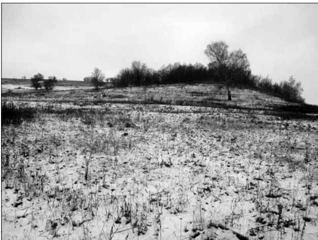
Пагорб, біля підніжжя якого копав гончарну глину Мефодій Сердюченко. Міські Млини, Полтавщина. Січень 2018.