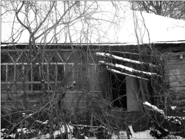
Колишній будинок гончаря Мефодія Сердюченка. Міські Млини, Полтавщина. Січень 2018.