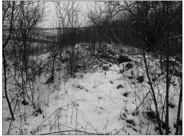
Залишки гончарного горна Мефодія Сердюченка. Міські Млини, Полтавщина. Січень 2018.