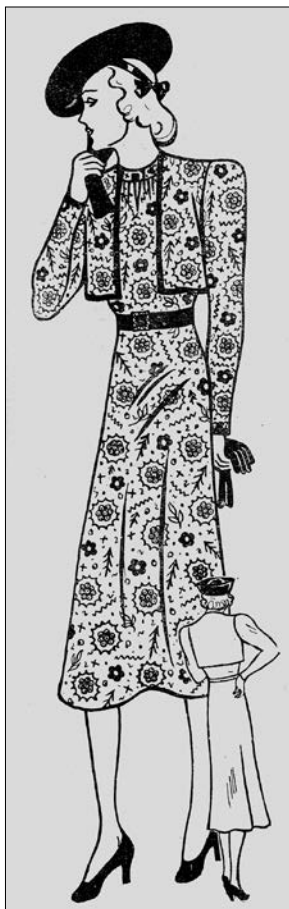
Іл. 2. Проект жіночого літнього ділового вбрання з вибійки від «Нової Хати»