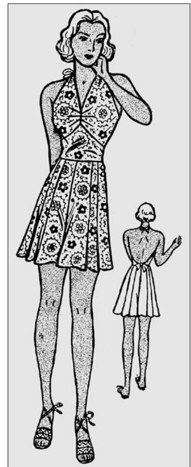
Іл. 5. Проект жіночого пляжного вбрання з вибійки від «Нової Хати»