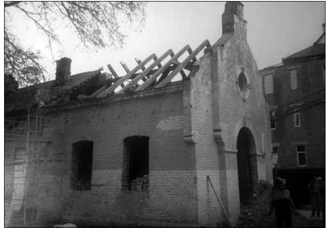
Іл. 5. Каплиця Божого милосердя (стан до відновлення). 1990-ті рр., м. Івано-Франківськ