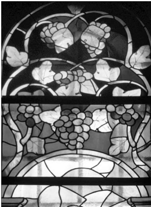
Іл. 2. С. Горб'юк. Фрагмент вітража у церкві Царя Христа. 1994 р., м. Івано-Франківськ

підхід вдало вирішив проблему вузьких віконних отворів храму.