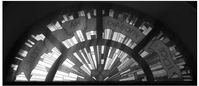
Іл. 6. В. Федоряк. Вітраж у каплиці Божого милосердя. 2017 р., м. Івано-Франківськ

білий колір використовувався для означення небесного сяйва, яке перетворює, преображає, очищає й освячує все земне і матеріальне...» [9, с. 105].