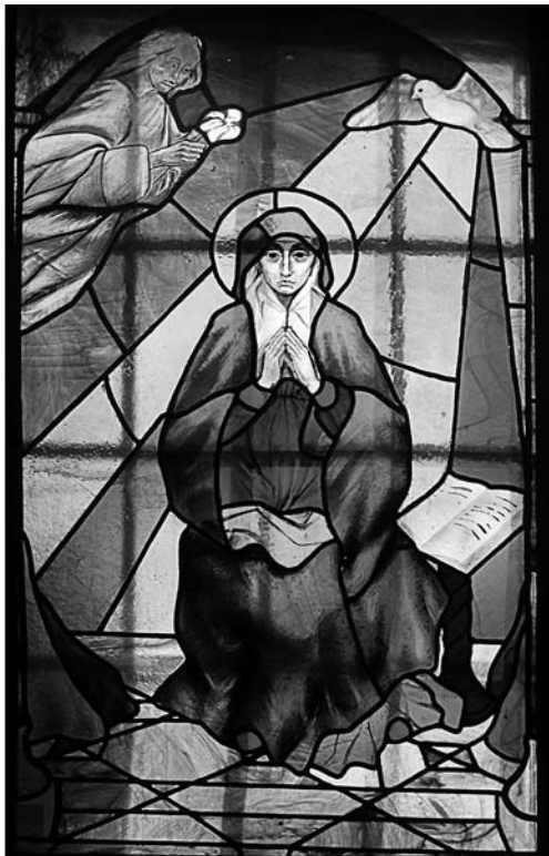
Іл. 4. С. Горб'юк. Вітраж «Благовіщення Пресвятої Богородиці». 1994 р., м. Івано-Франківськ

фів ікон [7, с. 62]. Пластична лінія рослин з листям та плодами в насичених тонах чітко прочитується на темному тлі й вдало замикає композицію.