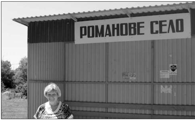
Автор статті у науковій експедиції в с. Романове Село, 2015 р.