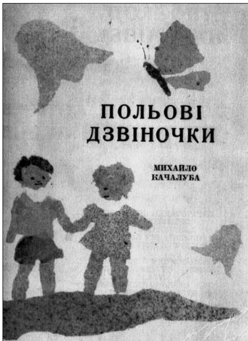
Збірка дитячих віршів «Польові дзвіночки». 1966