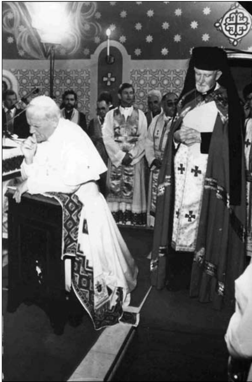
Папа Іван Павло II під час Архієрейської служби Божої в українському кафедральному соборі Аргентини, Буенос-Айрес, 1987 р.