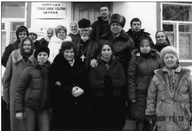
Єпископ Андрій Сапеляк у Верхньодніпровську, 2008 р.

Значний відгомін у пресі мав також виступ владика Сапеляка щодо релігійної свободи. Загалом єпископ Андрій Сапеляк п'ять разів виступав на Соборі як фахівець канонічного права, вносив свої пропозиції, які були прийняті до уваги під час опрацювання соборових документів. Єпископ Сапеляк на Соборі здобув загальне визнання і високий авторитет у церковних колах світу. Для української історичної науки Отець II Ватиканського Собору кир Андрій написав унікальну працю «Українська Церква на II Ватиканському Соборі», яка вийшла