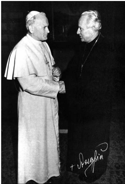
Папа Іван Павло II і єпископ Андрій Сапеляк, Рим, Ватикан

Митрополит Андрей Шептицький, сказавши знамениті слова, що мають неперехідну цінність: «Патріот, який не є християнином, єсть злим патріотом...» [10, с. 407].