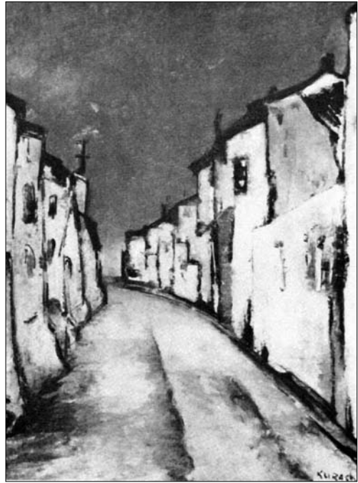
Іван Курах. Вулиця міста. 1950-ті рр.

ISSN 1028-5091. Народознавчі зошити. № 6 (138), 2017