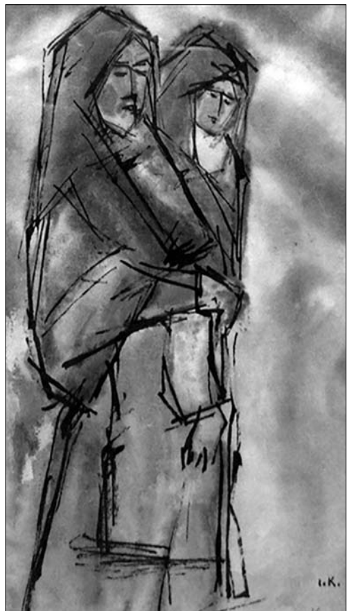
Іван Курах. Мати з дитиною. 1960-ті рр.

значення 50-ліття творчої діяльності Олександра Архипенка. На початку своєї блискучої промови до