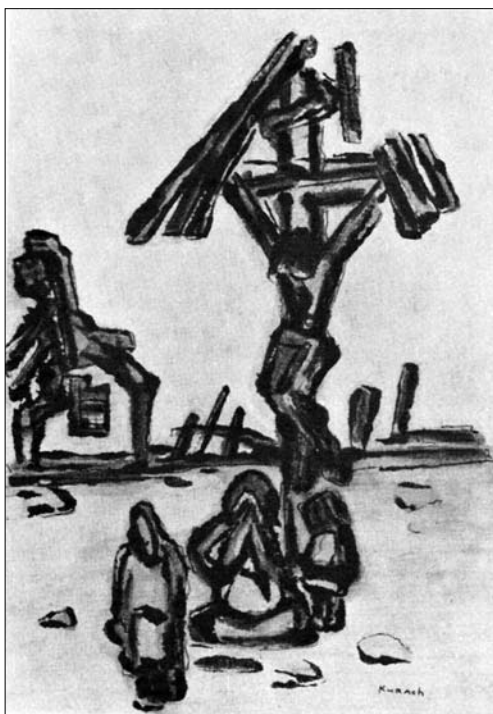
Іван Курах. На руїнах . 1940-ві рр.

у Венеційському біенале сучасного мистецтва (1950). І вже далі українська преса у вільному світі намагається відстежувати події, пов'язані з художником аж до самої його смерті.