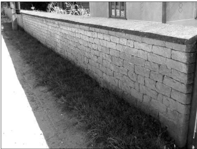
«Мури» з тесаного каменю (Тлумацький р-н)

ли давніші «лежачі плоти». Основу такої огорожі становили вкопані у землю (приблизно на 0,7—1 м завглибшки) дубові стовпи з вибраними у двох протилежних бокових площинах поздовжніми пазами («гарами»), у які закладали «замітник» (дошки чи інше). Стовпи розташовували на відстані 3—3,5 м один від одного. Висота такої огорожі могла бути різною, проте здебільшого вона коливалась у межах 1,5—2 м. Для захисту «паркана» від атмосферних опадів над ним влаштовували ширший (с. Рибне Кос.) чи вужчий двоххилий дашок, який накривали дралицею, часом соломою чи гонтою. Інколи схил дашка з боку двору міг сягати й 1,2—1,5 м (в такому разі його додатково підпирали, а утворене піддашся використовували для господарських потреб). У першій половині ХХ ст. як «замітник» зазвичай використовували різані соснові (інколи тополеві: с. Долина Тлум.) дошки завтовшки 5—6 см, проте давніше для цієї мети могли використовувати й ко-