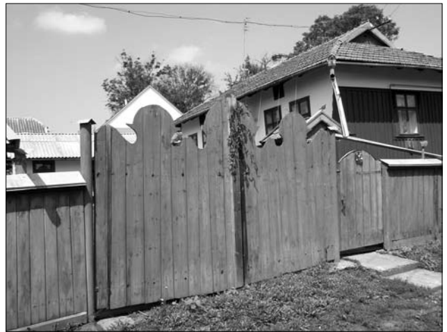
Брама з хвірткою (Коломийський р-н)

правда, огорожа «воринням» у цій місцевості мала свої особливості: коли на Гуцульщині висота колів огорожі могла сягати й 4-х м, то тут їх робили значно меншими (1,5—2 м) [10, с. 369]. Знову ж, для влаштування другорядних огорож вориння спорадично використовували практично по усій території підгірської частини Покуття.