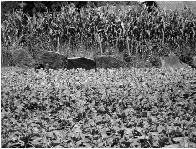
Залишки огорожі між садибами з вертикально встановлених плит (с. Городниця Городенківського р-ну)

у побут покутян поступово входять ворота з «штахет» (вертикальних круглих тичок чи протесаних латок), закріплених цвяхами до двох горизонтальних лат рами каркаса.