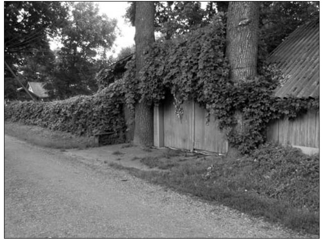
Огорожа двору живоплотом (Тлумацький р-н)