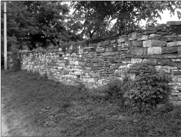
«Мури» з каменя (Городенківський р-н)