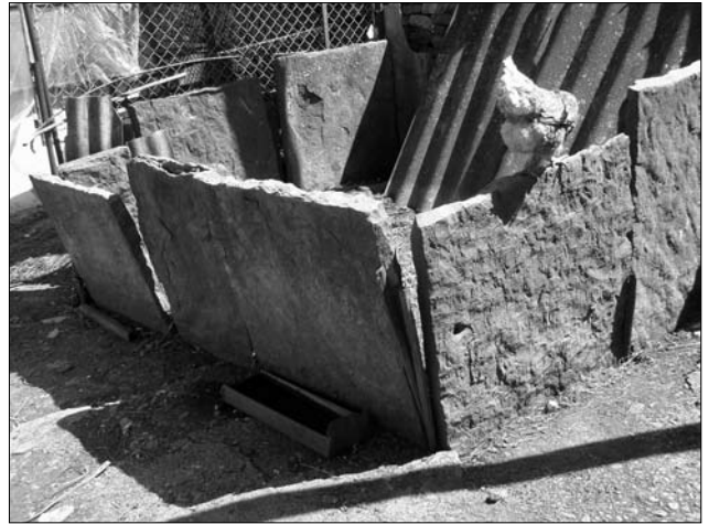
Огорожа «гноянки» з вертикально встановлених плит (с. Городниця Городенківського р-ну)

Давнє походження тут має також огорожа, мурована з каменя, так звані «мури». Найчастіше її споруджували з пісковиків (сірого чи червоного), при його відсутності — з вапняку. Видобутий у кар'єрах пісковик кололи на плитки чи менші шматки. При спорудженні «мурів» каміння закріплювали на розчині глини чи «болота», проте при наявності рівних плиток, які щільно прилягали, розчину не використовували, а клали «на сухо». Висота такої огорожі, залежно від місцевості, була різною: від одного до двох—трьох метрів, ширина сягала приблизно 0,6 м. Зверху «мури» прикривали плитами або насипом валом глини, який поростав специфічними трав'янистими рослинами. Кам'яні огорожі Покуття, на відміну від деяких інших придністровських районів (наприклад Буковини [10, с. 367]), відзначаються особливою акуратністю та монументальністю. Слід відзначити, що у цих місцевостях зчаста з каменя витісували і ворітні стовпи огорожі. У верхній частині їх фігурно протісували, інколи декорували хрестами чи шестилистниками (с. Семаківці Гор.). Зазвичай кам'яні огорожі залишалися не тинькованими, проте в окремих випадках (наприклад у дея-