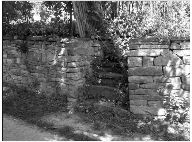
Вхід у двір (Тлумацький р-н)

В'їзд на подвір'я здійснювали крізь «ворота» або «браму». Найбільш поширеними (і давніми) буди рещітчасті одностулкові «ворота». Їх становило кілька горизонтальних жердин чи протесаних з усіх боків лат, які запускали в отвори двох вертикальних брусків («бильця»), розташованих по краях воріт (зчаста ще один вертикальний брусок присутній і посередині воріт). У більшості випадків конструкцію додатково зміцнювали одна чи дві навскісні поперечки. Повертались «ворота» на дерев'яному «бігуні», утвореному верхнім і нижнім виступами одного з крайніх брусів («вуха»), який фіксували до ворітного стовпа лозовим «вужівкою» («калачиком») чи спеціальним дерев'яним гаком. Висота таких воріт сягала зазвичай 1,2—1,3 м, довжина приблизно 2,2—2,5 м. Подібні «ворота», які складалися з шести горизонтальних жердин («ворин»), закріплених у двох вертикальних боковинах («со-