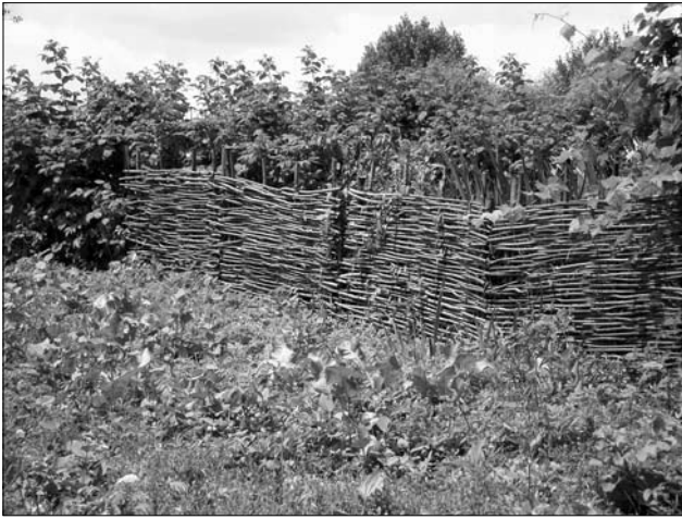
Лежачий пліт (Коломийський р-н)