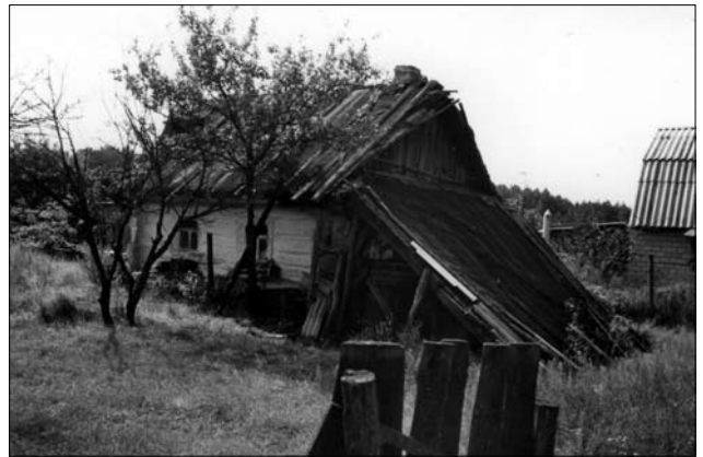
Хата др. пол. ХІХ ст. у с. Феневичі Іванківського р-ну Київської обл.

Щодо тридільного житла типу хата + сіні + комора (стебка), яке вже у середині ХІХ ст. було одним із найбільш поширених [27, с. 52], на Поліссі збереглися релікти, які дають змогу прослідкувати два шляхи його генези: безпосередньо з однодільного та з дводільного [29, с. 62—63; 55, с. 553]. К. Мошинський висловлював думку, що (як один із можливих шляхів розвитку) на теренах Полісся таке житло могло виникнути безпосередньо із однокамерного, шляхом об'єднання двох окремих будівель: однокамерної хати і стебки чи кліті. Відповідно до його гіпотези, зруби хати і господарської споруди ставили навпроти і звертали входами один до одного. У процесі подальшого розвитку простір між ними стали загороджувати, а з часом — перекривати спільним дахом [55, с. 552—554]. Достовірність гіпотези К. Мошинського, з тими чи іншими застереженнями