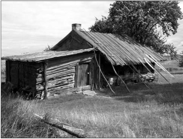
Хата сер. — др. пол. XIX ст. у с. Великі Цепцевичі Володимирецького р-ну Рівненської обл.

закиданих зверху омяєм чи соломою» [36, с. 158]. У с. Росухи колишнього Мглинського повіту (Брянське Полісся) в невеличких однокамерних оселях одинаків («бобилів») сіни замінювали «припять» — жердини, приперті похило до порогового причілка, прикриті «суволокою» (волокнистими рослинами, які згрібали з городів восени після збору коноплі і вживали для захисту холодних приміщень від вітру) [15, с. 87]. Про давність походження таких односхилих сіней-заслон, на думку К. Мошинського, промовляє саме походження слова «сіни»: етимологія виразу «сень» ( sien ) — є тїнь, заслона 9 .