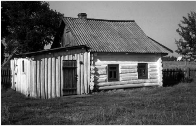
Хата сер. XIX ст. у с. Залав'є Рокитнівського р-ну Рівненської обл.

31]. М. Могильченко теж відзначав, що на Лівобережжі (с. Полошки Глух. Сум.) трикамерну хату складають три окремі частини [23, с. 86]. Описуючи процес спорудження тридільного житла на Поліссі Брянщини, М. Косич наголошував, що спершу «рубляться» дві хати, одна навпроти одної, а вже відтак у двох їх внутрішніх кутах «вкопують шулки, куди і закладають поліна, що утворюють сіни» [15, с. 82]. Таку ж думку стосовно еволюції трикамерного поліського житла висловлював М. Приходько: «Кліть і комора рубились окремо, а відтак вони з'єднувались сіньми, стіни яких зводили після того, як були споруджені кліть та комора, і як правило, [вони] робились в закидку або були плетневі [з хворосту]» [26, с. 251—252].