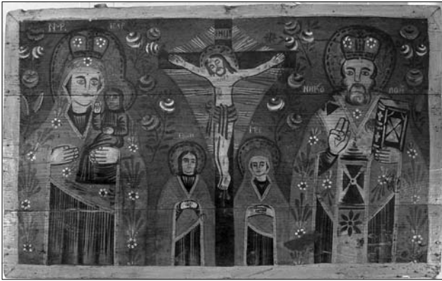
Інтер'єр світлиці в с. Великий Кучурів Чернігівської обл., 1990-ті рр.

образу, спосіб звернення до нього, потреба у спілкуванні з Праобразом становить суть численної богословської літератури, яка є невід'ємними помічником у формуванні підходів до висвітлення хатньої ікони. Зокрема, В. Лепакін обґрунтовує питання «іконообразу» як виразу православного світобачення і світорозуміння [21], Я. Креховецький висвітлює іконографічну символіку [20]. Узагальнюючий аспект сприйняття православної ікони у світовій культурі та відмінності вшанування Діви Марії у церквах різних конфесій містить праця Г. Фішера [77].