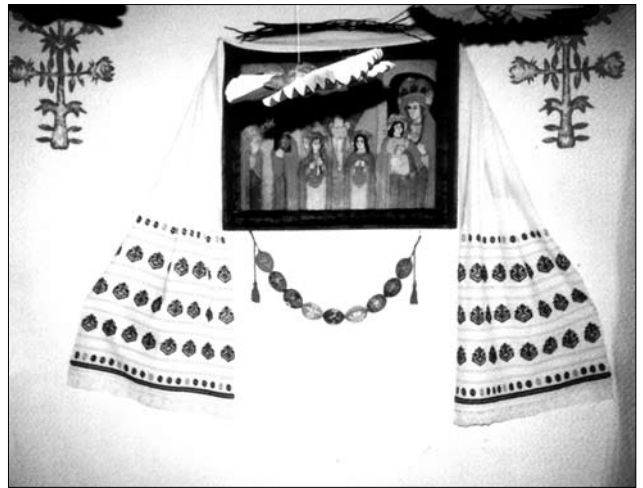
Богородиця з Дитям, Розп'яття з Пристоячими, св. Миколай. Хатня ікона на дереві. Походить з Івано-Франківської обл., приватна збірка

Особливості впливу монастирів на розвиток іконописної школи на Прикарпатті аналізує О. Чуйко — він зазначає, що декілька «стійких іконографічних ти-