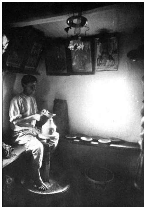
Гончар при праці, с. Огівка Сквирського повіту. Опубліковано: [74]

Великий внесок у формування стратегії дослідження хатніх ікон зробив київський мистецтвознавець О. Найден. Йому належить новітня концепція висвітлення образу воїна в українському народному мистецтві, яка полягає у синхронному зіставленні усних джерел (фольклорно-історичних) з образотворчими. Автор аргументовано доводить, що обра-