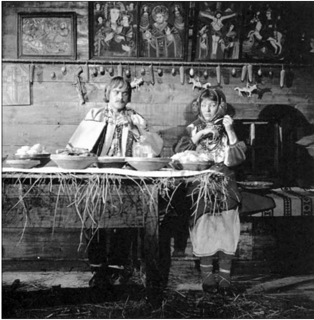
Інтер'єр гуцульської хати другої пол. XIX ст., відтворений для зйомок фільму «Тіні забутих предків», 1963 р.

ментальному дискурсі явища та його значенні для всієї європейської культури. Трактуючи хатні ікони в контексті «символокомплексу», певні застереження викликає теза автора про відсутність тягlosti традиції щодо церковних та домашніх ікон [10].