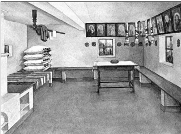
Селянська хата, вид на покуття, с. Жеребки, повіт Старо-константинів. Опубліковано: [74]

було провести в окремій студії еволюційні фази розвитку від ікони, якою є ще хатній образ ... до так дуже типового хатнього галицького примітиву-образу» [8]. Водночас І. Свенціцький зазначав, що народну творчість неоправдано зачисляють до т. зв. «малого» мистецтва, пов'язуючи його з ремеслом [8].