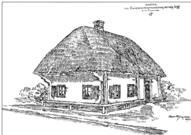
Хата по Єлисаветинському проїзді ч. 35 в м. Харкові. Оpubліковано: [62]

Традиційну обрядовість Західної України (у зв'язку з відмінною політичною ситуацією) вивчали, окрім українських, австрійські та польські дослідники. Етнограф Р. Кайндль описав гуцульський звичай «висвячення» образів — їх купували восени і заносили до церкви. Лише після тривалого храмового зберігання ікони забирали додому. На них найчастіше зображували святих Миколая, Івана Хрестителя, патрона Буковини Івана Сучавського, децю