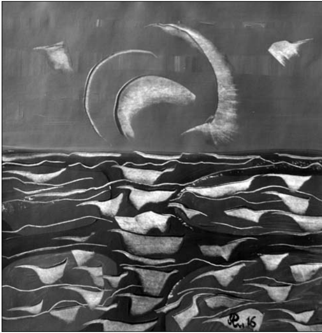
Спомин про море. Фантазія. 2015. Папір, кольорова туш, акрил. 48,5 x 48 см