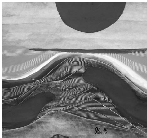
Високе сонце у високих горах. 2015. Папір, кол. туш, акрил. 32х34 см