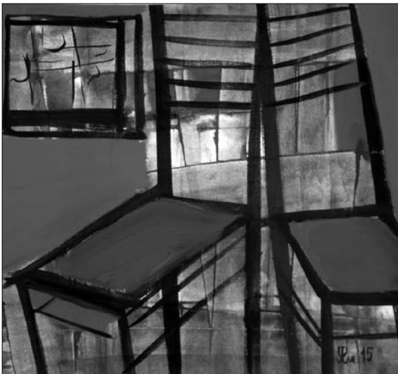
Інтер'єр. 2015. Папір, кол. туш, акрил. 32х34 см