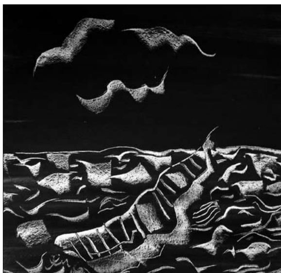
Неспокійне море. 2016. Папір, туш, акрил. 48х48 см