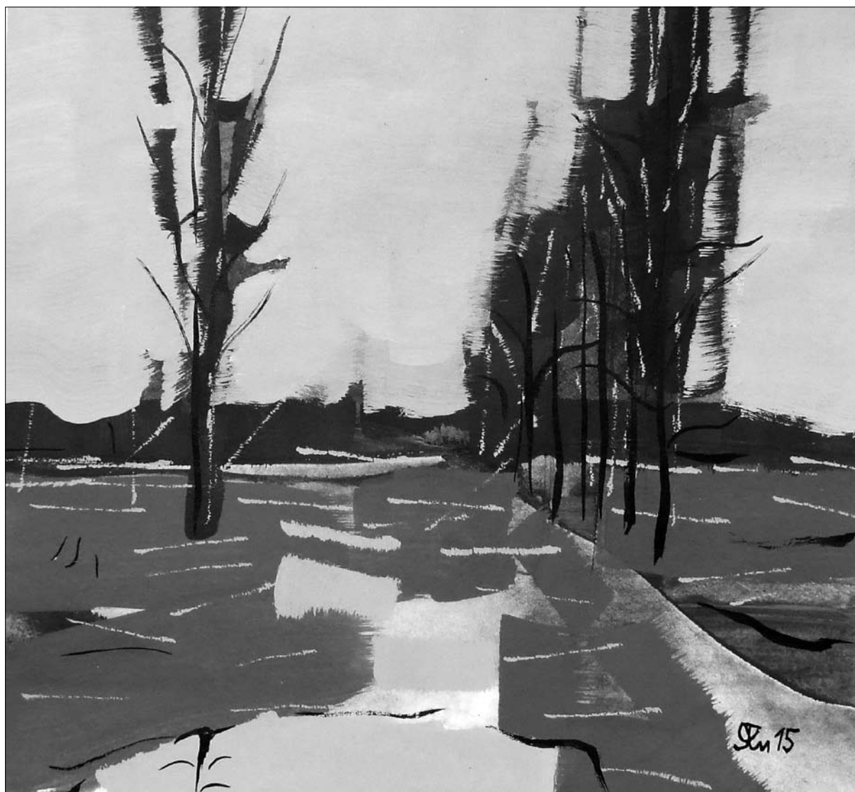
Дорога до Голешева. 2015. Папір, кол. туш, акрил. 32х34 см