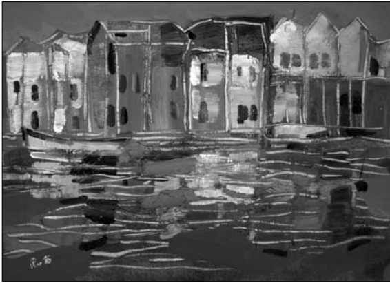
Кольоровий сон про Гданськ. 2016. Полотно, олія. 50х70 см