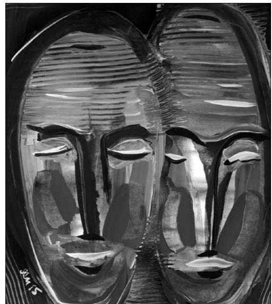
Двоє. 2015. Папір, кольорова туш, акрил. 38х33 см

Належний науковий рівень дозволить Роману Яціву обійняти посаду заступника директора з наукової роботи Інституту народознавства НАН України та бути відповідальним секретарем періодичного багаторічного наукового видання установи — «Народознавчих зошитів», яке, практично, стало його дітищем, й опіку над яким він не полишив і сьо-