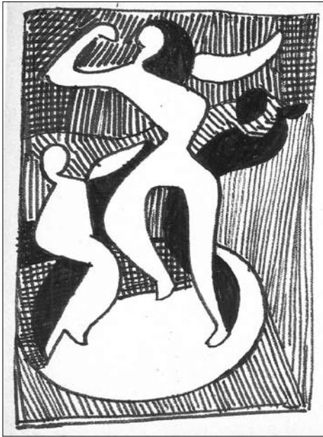
Леопольд Іванович Левицький. Композиція «Танцюючі». Папір, фломастер. 1960-ті рр. (публікується вперше)

такий діалог: «Льоблю, підемо на рідну хату, де ти виріс». Він мовчав. Ще раз повторила просьбу. «Ні! Ти піди, а я буду тут на стадії. В'арвари! В'арвари! Як їм могло прийти у голову спалити працю моїх рук!». Дивився довго, і сльози самі побігли на очі. Обнялися, і у тиші, без єдиного слова, довго так сиділи» 4 .