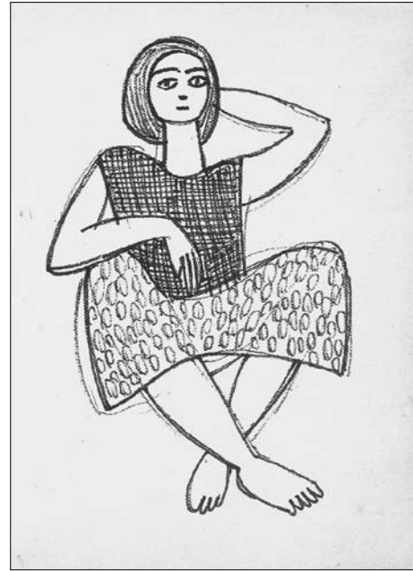
Леопольд Іванович Левицький. Композиція «Жінка з відкинутою рукою». Папір, фломастер. 1960-ті рр. (публікується вперше)

Леопольд Левицький відзначав, що цей етап у його творчості надає змогу майбутнім митцям пройти вже прокладеним шляхом: «А то, що мені це випало, того і немає. Мене, як шофера, посадили за руль так, і сказали: «Леопольде, добре дивися, і на папір клади». Уся хитромудрія цієї філософії. Розказав би комусь про це, то ніхто би і не повірив у мої слова. Хвиля виносить когось одного на берег, щоб потім усі могли легко піти по суші. Мене із усіх боків тиснуть композиції і хочуть на світ Божий. Я є інструментом у Божих руках» 8 .