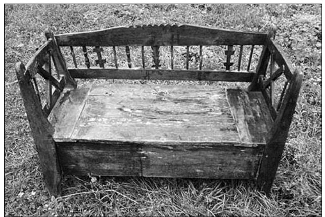
Лави-«шафарня», с. Буковцево (Великобержезнянський р-н, Закарпатська обл.). МНАП № АП-1928

шованих поміж ними пронижок. Поміж пронижками у видовбаних у них прямокутних гніздах у верхній (знизу), а нижній (зверху), вставляв прямокутні перетинки заввишки 35 см, завширшки 4 см, завтовшки 3 см. Верхні гнізда у приплічній частині, як і в заплічній, видовбані глибше за нижні. Майстер перетинки вставляв спочатку у верхнє гніздо на його глибину, опісля опускав і загонив у мілкіше нижнє. Далі у видовбані в ніжках гнізда вбивав дошки опалубки-скрині та профілювану заплічну. Поміж горішньою заплічною дошкою та нижньою опалубки, вмонтовували 30 прямокутних перетинок заввишки 15 см, завширшки 3 см, завтовшки 2 см. Такий бамбетль-«шафарня» виконував кілька функцій: сидіння на дошках лави, тимчасового відпочинку, спання, а в разі виникнення потреби скриня-опалубка була сховищем для одягу, сипучих продуктів [10, арк. 37].