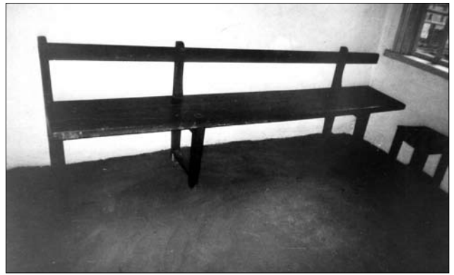
Лаву із запліччям, сер. XX ст., с. Макалевиці (Радомишльський р-н, Житомирська обл.). Світлина В. Сивака, 1996 р.

У 20—30-х рр. XX ст. у хатах з опаленням «почистому» в облаштуванні житла впроваджують лави із запліччям, які відзначалися довільністю розмірів, форм, з'єднань і утримувалися частіше на двох, іноді на трьох суцільних або попарно розташованих ніжках. Вони побутували в усіх досліджуваних селах,