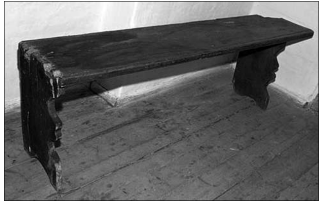
Лавка, с. Звенигород (Буцацький р-н, Тернопільська обл.), 30-ті рр. XX ст. МНАП № АП-14465

За зібраними матеріалами з польових етнографічних експедицій на Покуття та Опілля, треба зазначити, що пересувні лави-канапи побутували тут у 20—30 рр. XX ст. Вони зафіксовані в усіх досліджуваних селах краю: сс. Городниця, Передівання, Копачинці, Вільхівці, Торговиця, Топорівці, Росохач, Вікно, Серафимівці, Незвисько, Бортники (Гор. ІФ.) [8, арк. 1—66], Хотимир, Делева, Братишів, Петрів (Тлу. ІФ.) [8, арк. 67—85], Стриганці (Тис. ІФ.) [8, арк. 86—87], Перевозець, Перекоси, Верхне, Мислів, Довпотів, Височанка (Кал. ІФ.), Лука Острів, Бринь, Комарів, Павлівка, Козина, Крилос, Ме-