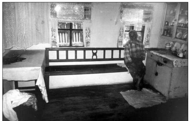
Лави із запліччям, сер. XX ст., с. Сингаї (Народицький р-н, Житомирська обл.). Світлина В. Сивака, 1996 р. ням, пластику профільованих деталей зафіксовані лави-шафарні в селах Новоселиця, Зарічово, Лікіцари (Пер. Зк.), Ростоцька Пастіль (Вел. Зк.) [6, арк. 24, 56; 7, арк. 11, 14, 16, 21, 31].

Спорідненими з описаними лавами-«шафарнями» є тотожні вироби, які експонуються у МНАП. Вони близькі за розмірами, формою, конструктивним вирішенням та профілюванням. Такі є зі сс. Сокирниця (Хус. Зк.), Брід (Ірш. Зк.), Верхня Визниця (Мук. Зк.), Буковцево (Вел. Зк.), Зарічово, Турички (Пер. Зк.) (МНАП інв. № АП-10402, АП-9282, АП-9905, АП-1929, АП-13298, АП-15522, АП-1928).