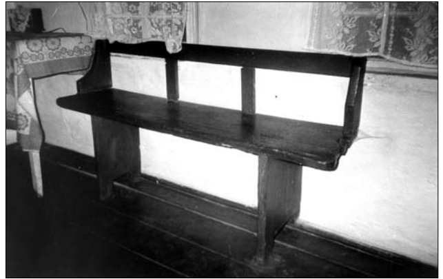
Лави із запліччям, сер. XX ст., с. Рудня-Базарська (Народицький р-н, Житомирська обл.).