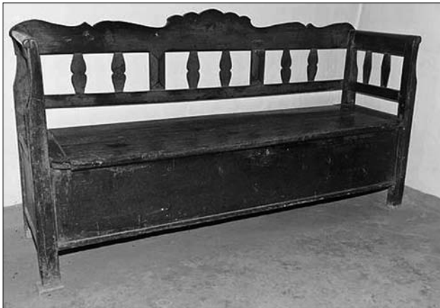
Лава-«шафарня», поч. XX ст., с. Брід (Іршавський р-н, Закарпатська обл.), МНАП № АП-9282

«канапа» [18, с. 27]. Тут його виготовляли переважно з бука та смереки, на Гуцульщині зі смереки, на Бойківщині — смереки, дуба, ясеня, ялини, модрина. Часті деталі виробу виготовляли з різних порід деревини. Ножки, підлокітники виготовляли з твердих порід, інші деталі виробу, — з м'яких. На думку автора, бамбетель, за його функційним призначенням, розмірами, формою, з'єднаннями споріднений із лавою-канапою та лемківською лавою-шафарнею. Розміри бамбетля в середньому становили 180—200 см, лава до сидіння та спання завширшки 60—70 см, заввишки задніх ніжок із запліччям — 85—90 см, заввишки від долівки до сідалишного місця — 50—55 см, заввишки від долівки до підлокітника — 65—70 см, завширшки скрині-опалубки — 20—25 см [15, с. 50]. Для зручного спання та тепла, у скриню-опалубку настеляли житню або вівсяну солому, висушене листя кукурудзи, а зверху застеляли рядниною. Верхню сідалишну частину бамбет-