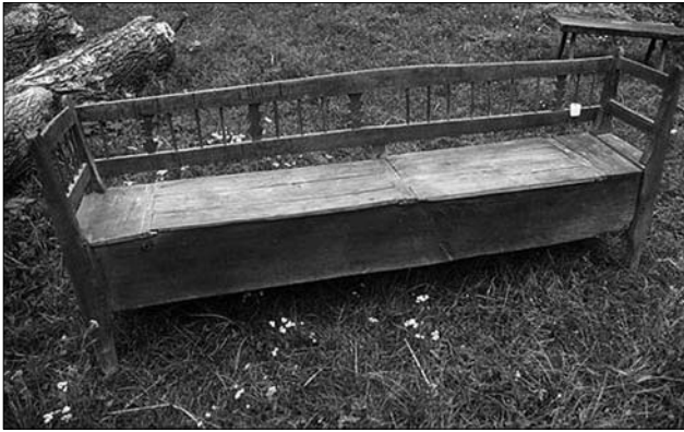
Лава-«шафарня», с. Буковцево (Великобerezнянський р-н, Закарпатська обл.). МНАП № АП-1929