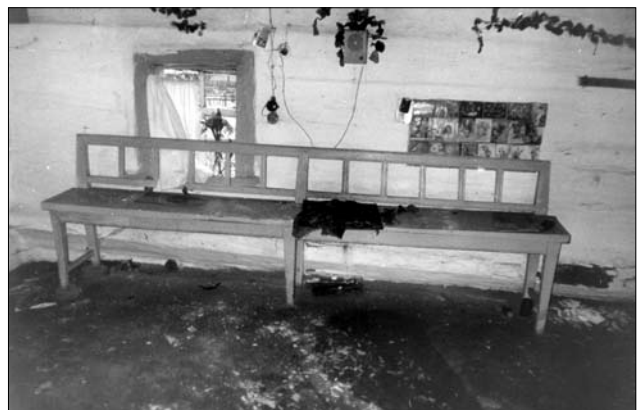
Лавка із запліччям, сер. XX ст., с. Рубежівка (Народицький р-н, Житомирська обл.). Світлина В. Сивака, 1996 р.

особливо на Поліссі. Поряд із різновидом таких лав у цьому періоді в інтер'єрі народного житла бойків, гуцулів, лемків, поліщуків, а ширше всього Південно-Західного історико-етнографічного регіону побутує різновид лав із запліччям та підлокітниками, які означували «канапа» (автор схильний називати лаву «канапа»). Такий предмет використовували переважно для сидіння, у разі виникнення потреби —