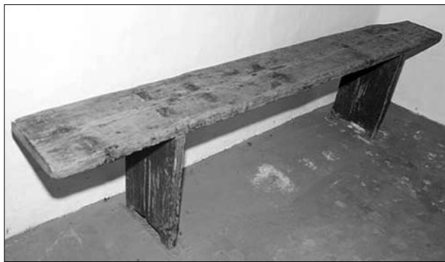
Лава, с. Верхня Визниця (Мукачівський р-н, Закарпатська обл.). МНАП № АП-9856