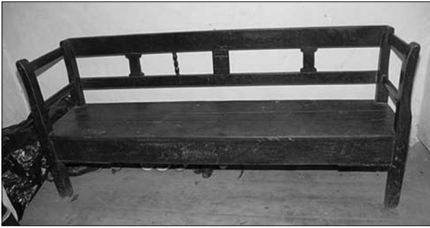
Лави-«шафарня», с. Зарічово (Перечинський р-н, Закарпатська обл.). МНАП № АП-15522