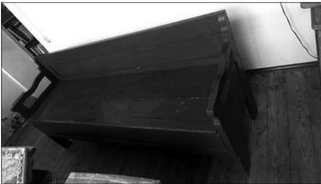
Лава-«бамбетель», с. Чертіж, Жидачівський р-н, Львівська обл., поч. ХХ ст. МНАП № АП-19214

на частина складається з трьох дощок, з'єднаних у нижній частині двома врізаними шпугами. Має додаткове висувне пристосування для снання «постіль». Прямокутні задні та передні ніжки в поперечному розрізі, профілювані підлокітники, ніжки. Основу запліччя складають прямокутна в поперечному розрізі рама, у якій із тильного боку бамбетля вибрана чверть, у яку вставлена вповодж дошка (МНАП інв. № АП-19214).