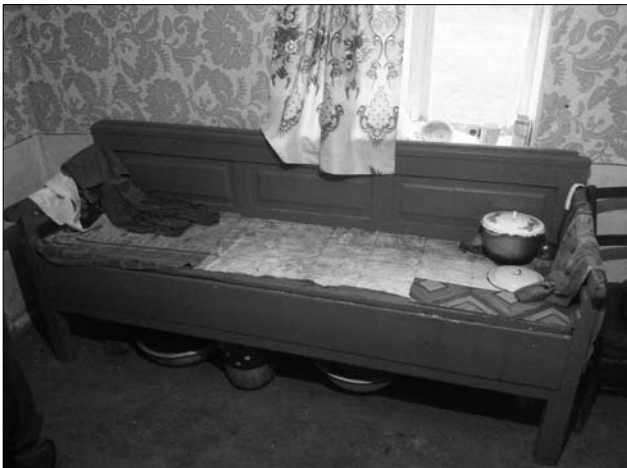
Лави-«бамбетль», сер. ХХ ст. с. Чернелиця (Городенківський р-н, Івано-Франківська обл.).

сільським столяром. Був завдовжки 190 см, завширшки 55 см, заввишки до підлокітника 65 см, від поперечного поперечного бруса до долівки 20 см, заввишки запліччя від лави 40 см, заввишки передньої дошки висувної постелі 25 см, завтовшки 3 см. Передні прямокутні в поперечному розрізі ніжки завтовшки 5 см, завширшки 6 см. Задні заввишки 90 см, завширшки 10 см, завтовшки 3 см. Підлокітник завтовшки 5 см, завширшки 6 см. Сідалишна лави виготовлена із двох дощок, з'єднаних двома врізаними шпугами. Майстер, насамперед, виготовляв окремо кожну деталь бамбетля за розмірами, формою, видовбаними в них гніздами, зарізаними чопами. Опісля монтував виріб. Спочатку з'єднував бічні частини бамбетля, передню та задню ніжки двома проніжками способом чопування та фіксацією кожного з'єднання дерев'яними тиблями. Частини припліччя з'єднував між собою поздовжніми прямокутними в розрізі брусами способом чопування та фіксацією тиблями. Одноразом з'єднував з основною частиною бамбетля запліччя. Його площину становила прямокутна в розрізі