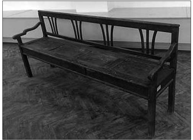
Лави-канапа, сер. XX ст., Львівщина. МНАП № АП-7260

Такими були сідалишна лава, деталі опалубки-скрині, заплічна та приплічна частина, ніжки, пронижки, перетинки. Насамперед, конструктивно з'єднував між собою приплічні деталі — задні та передні ніжки з допомогою верхніх та нижніх, горизонтально розта-