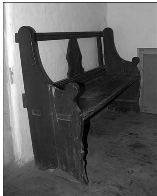
Лавка-«канапа», Рівненське Полісся, МНАП № АП-4935

духа, Тенетники (Гал. ІФ.) [8, арк. 1—87; 9, арк. 1—74]. За породами деревини, розмірами, формою, конструктивними варіантами споріднені із подібними виробами карпатського регіону.