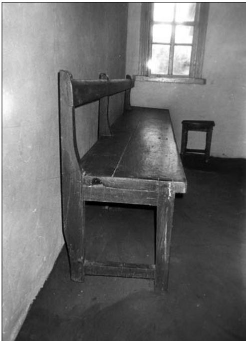
Лавка із запліччям, сер. XX ст., с. Макалевичі (Радомишльський р-н, Житомирська обл.). Світлина В. Сивака, 1996 р.