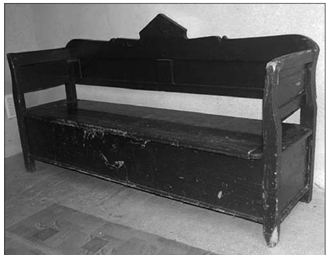
Лави («лада»), с. Верхня Визниця, Мукачівський р-н, Закарпатська обл., 20-ті рр. XX ст. МНАП № АП-13298

тально знизу в заплічній частині вмонтовані три прямокутні тахлеві вставки. Дошка в горішній частині запліччя профільована вдовж із двох сторін. З'єднання деталей заплічної та приплічної частин бамбетля способом чопування та фіксацією тиблями. Сідалишна частина виготовлена з однієї цільної дошки із вмонтованими знизу врізаними дубовими шпугами. Кути висувної фасадної та двох бічних дощок «постелі» з'єднані між собою врізаними замками у т. з. «ластівчиний», або в науковій літературі його ще означають «риб'ячий» хвіст. Висувна «постіль» утримувалася на двох ніжках [9, арк. 62].