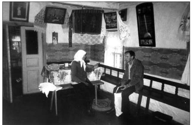
Фрагмент інтер'єру, с. Українка (Малинський р-н, Житомирська обл.). Світлина В. Сивака, 1996 р.