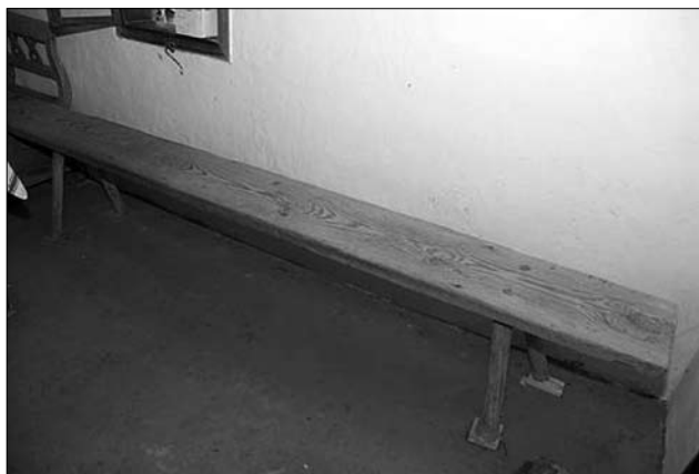
Лава («лавиця»), с. Брід (Іршавський р-н, Закарпатська обл.). МНАП АП-9345

грані ніжок-стояків — профільовані, задні — рівно стесані. Ніжки-стояки в нижній частині були завширшки 40 см, завтовшки 3 см. Передні грані ніжок-стояків поступово звужувалися до верху. Тут вони були завширшки 10 см, дошка лави з'єднувалася із ніжками-стояками за допомогою брусів вбитих у них. Заплічний брус в'єднувався у гнізда вирізані в горішній тильній частині ніжок-стояків [1, арк. 73].