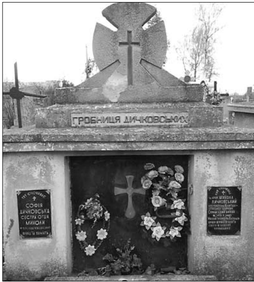
Гробниця Дичковських на Стрийському кладовищі

арк. 101]. З нього видно, які дзвони та скільки було реквізовано. З огляду на слабку прочитуваність документа (написаний простим олівцем) та важливість інформації для читачів, подаю повністю.