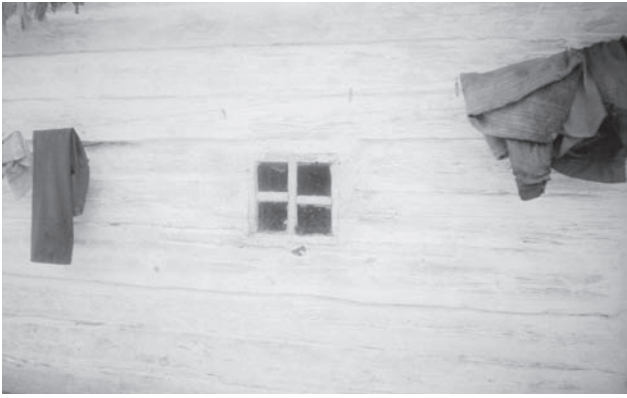
«Глухе» чотиришибкове вікно у хаті; Олевський р-н Житомирської обл.

Київ.). В окремих місцевостях Полісся Житомирщини (сс. В'язівці, Жерев, Латаші, Селець, Залісся Нар., Клинець, Млини, Гладковичі, Гошів, Мала Фосня, Велика Фосня, Велика Чернігівка, Рудня, Піхоцьке Овр.; Радогоща, Бовсуни Луг.; Киянка, Кривотин Єм. та ін.), а зрідка і Київщини (с. Стещина Пол. Київ.) верхньому елементу («верхняку») віконної (як і дверної) коробки надавали заокругленої форми. Появу таких вікон («з овальною верхньою частиною») у поліському житлобудівництві окремі дослідники пов'язують з поч. ХХ ст. [45, с. 142], проте джерельні матеріали дають можливість стверджувати про їх більш давнє походження. Зокрема вікна «з круглим главнем» М. Левченко спостерігав ще у третій чверті ХІХ ст. у с. Меленях колишнього Радомишльського повіту, а також «в старинних хатах» колишніх Чернігівської та Полтавської губерній [26, с. 136].