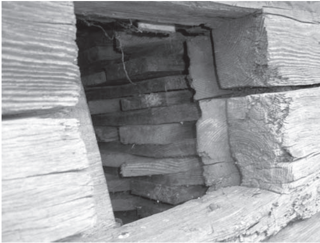
Волокове вікно; Сарненський краєзнавчий музей (Рівненська обл.)

(1656—1657) більш детально описав К. Гільденбрант (Середня Наддніпрянина) 16 . Технологія виготовлення такого «скла» була доволі простою. Наприклад, на Бойківщині свіжий (ще вологий) мочовий міхур («капчук») вичищали «шкрябачкою» (поки він ставав прозорим), напинали на дерев'яну рамку й висували. Таке «скло», за словами старожилів, було доволі міцним — «пальцем його не проб'єш» 17 . З часом (очевидно вже у кін. XVIII — на поч. XIX ст.) у житлобудівництві поліщуків поступово проникає скло 18 . Спершу це були невеличкі товсті, майже непрозорі зелені скельця круглої