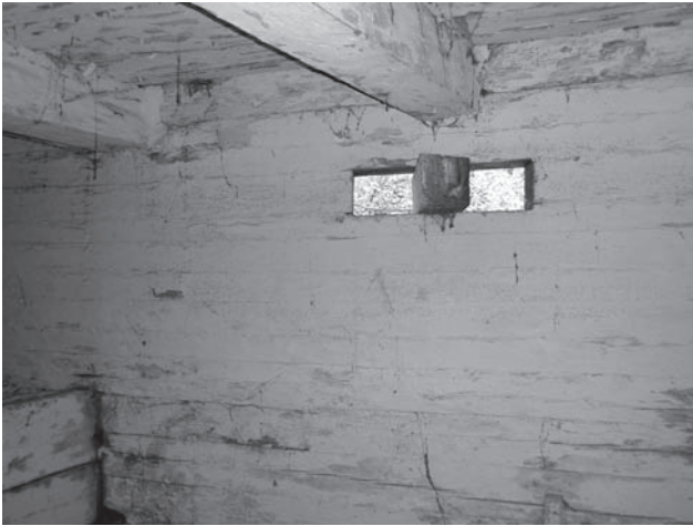
Вікно у коморі; с. Барішів Ємільчинського р-ну Рівненської обл.

Таке первісне використання вікон підтверджують матеріали XVII століття. Скажімо, Ульріх Вердум під час подорожі по Україні (1670—1672), описуючи курну хату русинів, відзначав: «...По обидвох боках в стінах будинку знаходиться кілька дир, ніби вікна, які відповідно до вітру відкривають або закривають, щоб дим через них виходив назовні» [58, s. 100—101]. Первісне призначення віконних отворів для відведення диму підтверджують й етимологічні матеріали [50, с. 112—114]. Лексема «окно» є загальнослов'янською і у давньоруській мові XI—XII ст., як зазначають дослідники, це слово («окъно», «окъньце») означало отвір взагалі, діру, дверку тощо [48, с. 55]. Проте слід зауважити, що вже у Давньоруський час у житлах панівного стану віконні отвори певною мірою могли використовуватись для освітлення приміщення. Наприклад, на території древнього Галича (городище біля с. Крилос Галицького р-ну Івано-Франківської обл.) у двох великих житлах XII—XIII ст. віднайдено шматки круглих віконних скелець з бордюром і рослинним розписним орнаментом жовтого, зеленого і коричневого кольорів [36, с. 71].