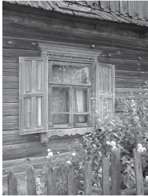
Вікно у хаті; с. Лотниця Зарічненського р-ну Рівненської обл.

Київ.). Частіше дубовим було лишень підвіконня (с. Грезля Пол. Київ.).