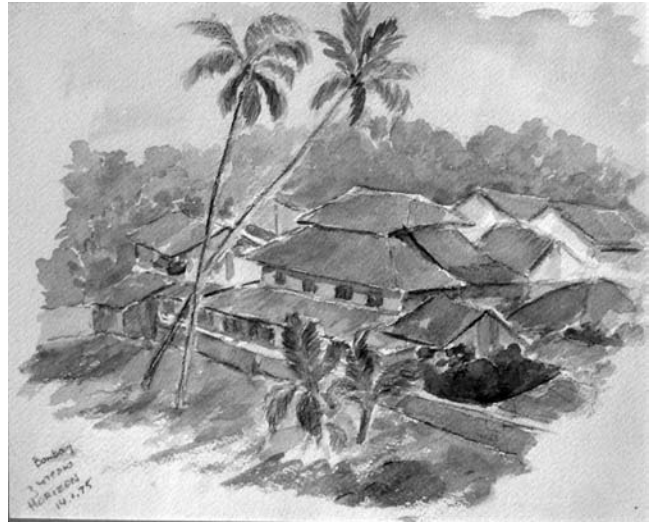
Юрій Старосольський. Куточок Бомбея. 1975. Папір, олівець, акварель. 20,3 x 25 см.