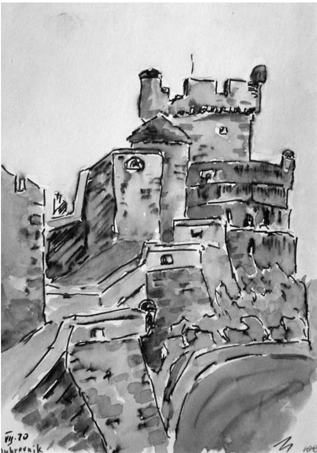
Юрій Старосольський. Дубровник. 1970. Папір, туш, розмивка, акварель. 21,5 x 15,2 см.

художньою поетичною натурою “завжди усміхнений, веселої вдачі, товариський і братерський”, тяжів скоріше до культурно-просвітницької і громадської роботи серед пластової молоді. Писав для них пісні, друкував поезії і нариси, виступав з рефератами. Певний час (1931-34 рр.) разом із сестрою Уляною редагував у Львові журнал для молоді “На Сліді” 4 .